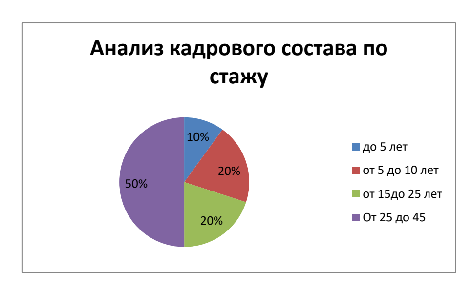
Диаграмма с характеристиками кадрового состава детского сада